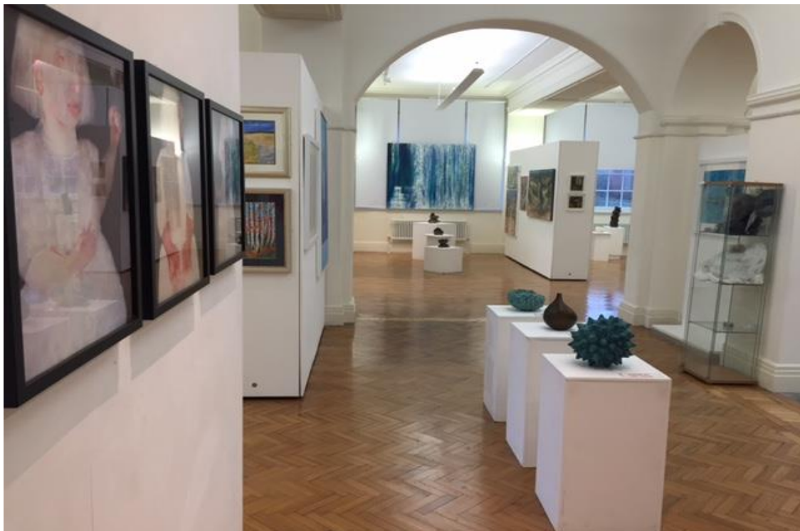
Cyngor Bro Morgannwg – Oriol Celf Ganolog – ‘10’ Arddangosfa Agored 2017 Llyfan i dros 90 o artistiaid a 220 o weithiau celf