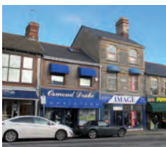
Hettie Mackenzie 107 Stryd Glebe