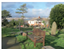
Bunty Thomas Eglwys Awstin Sant