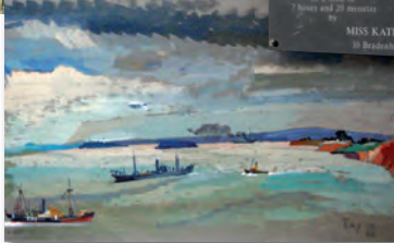
'Not One of Ours' 1942, Ray Howard-Jones