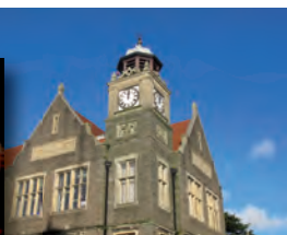
Llyfrgell Penarth Joan Collins