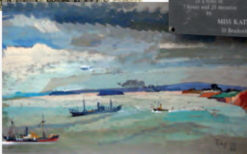
'Not One of Ours' 1942, Ray Howard-Jones