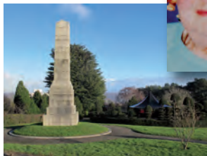
Emily Pickford Cofgolofn Ryfel