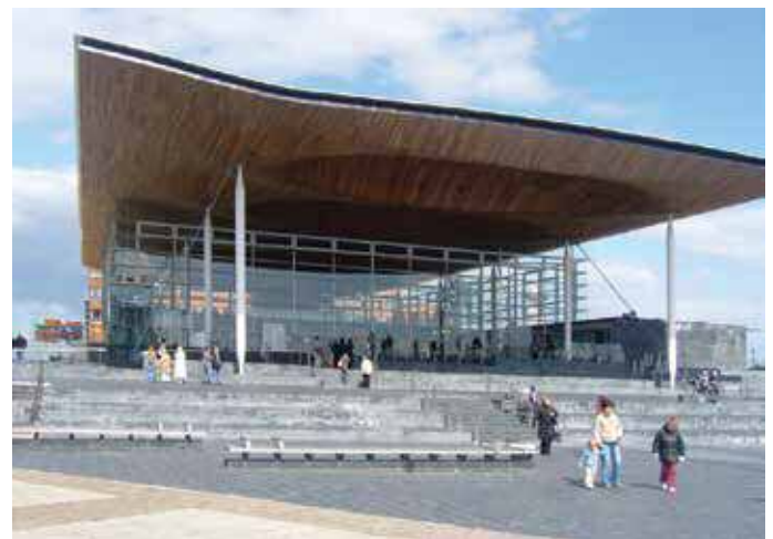
Epilepsy Aware at Senedd

Join us at The Pierhead Building, Cardiff Bay, between 12noon – 1.30pm on May 21st – it is an unique opportunity to raise your concerns about epilepsy treatment, both locally and across Wales.