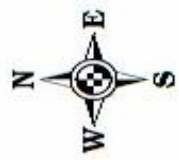
MAP O FRO MORGANNWG

© Crown copyright. All rights reserved. The Vale of Glamorgan Council Licence No. 100023424 2006. © Hawlfraint y Goron. Cedwir pob hawl. Cyngor Bro Morgannwg rhif trwydded 100023424 2006.