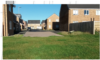
Ffens pren isel a bolard i('w osod gan eraill)