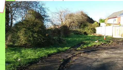
Creu mynedfa newydd i'r parc i fwrdd o dai. Bydd llystyfiant yn cael ei dorri yn ôl i agor llinellau golwg, sbwriel yn cael ei symud a ffensio wedi'i osod i atal ymddygiad gwrthgymdeithasol.

System lliniaru llifogydd. Nid oes unrhyw waith i'w gynnal ger y nod-wedd hon