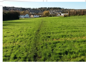
Llwybr troed arfaethedig i ddilyn llinell awydd presennol