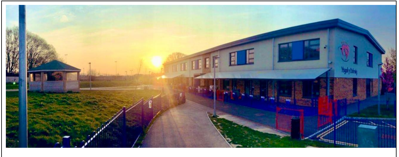
Ffigur 1: Delwedd o adeilad Ysgol Y Ddraig (golygfa allanol)

Mae Ysgol Y Ddraig yn elwa o ystafelloedd dosbarth o faint addas, prif neuadd ar gyfer chwaraeon a chiniawa, swyddfeydd i'r pennaeth a'r weinyddiaeth, ystafell athrawon, a manau ymneilltuo ar gyfer ymyriadau disgyblion. Mae'r ysgol wedi'i ffensio i ddiogelu disgyblion gyda mynediad intercom i ymwelwyr. O fewn y tir, mae ardaloedd chwarae allanol, ardal gemau aml-ddefnydd (AGAD) a manau cynefin i wella lles disgyblion.