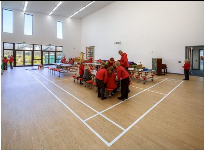
Neuadd uchder dwbl yn Ysgol Dewi Sant