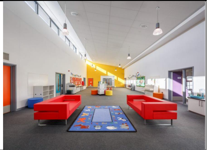
Ardal hyblyg "Calon yr Ysgol" yn Ysgol Dewi Sant