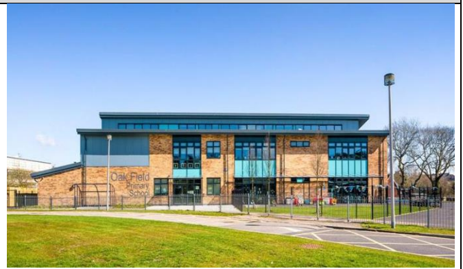
Golwg o Ysgol Gynradd Oak Field o'r tu allan