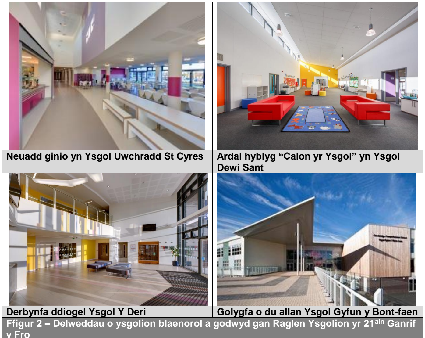
Ffigur 2 – Delweddau o ysgolion blaenorol a godwyd gan Raglen Ysgolion yr 21 ain Ganrif y Fro

www.valeofglamorgan.gov.uk/21st-Century-Schools