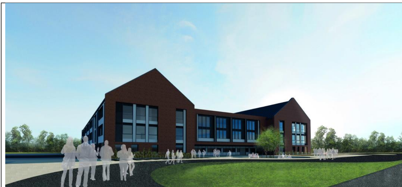
Ffigur 1 – Lluniad pensaer o adeilad YUW (golwg o'r tu allan)

Mae adeilad newydd yn cael ei godi ar gyfer YUW ar hyn o bryd ar ei safle presennol yn barod erbyn mis Medi 2021 (gweler ffigur 1 – lluniad pensaer). Mae ardal yn yr adeilad wedi cael ei dyrannu ar gyfer Canolfan Adnoddau Arbenigol.