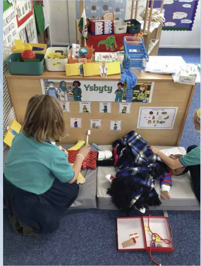
Chwarae rôl mewn cymeriad, meddygon yn gofalu am gleifion.