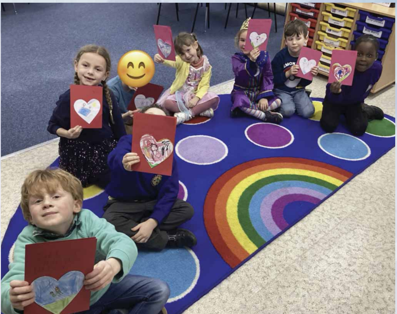
Dathlu Diwrnod Santes Dwywfen, Chwefror 2023.