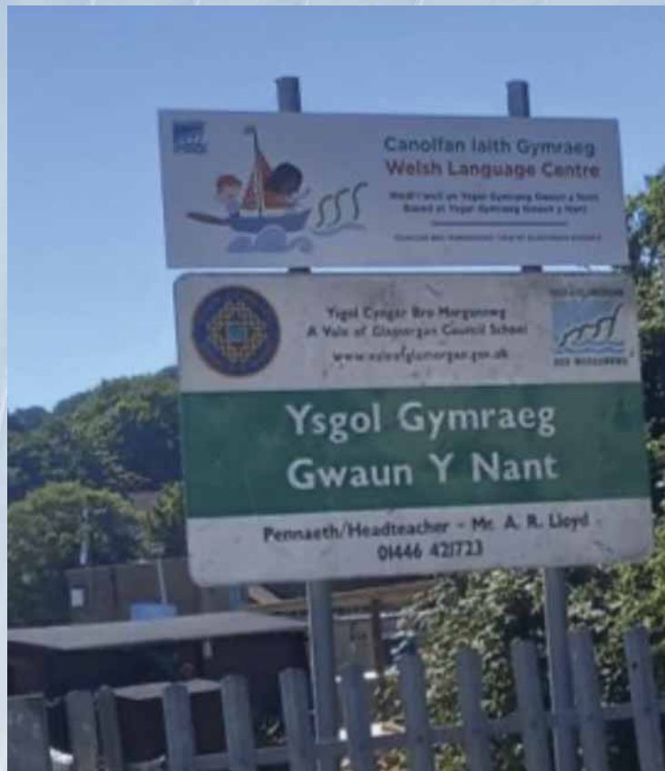
Canolfan Iaith Gymraeg.