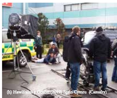
(h) Hawlfraint y Goron (2019) Sgrin Cymru (Casualty)