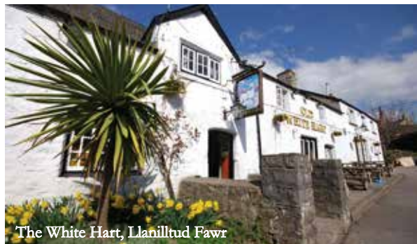
The White Hart, Llanilltud Fawr

I'r gogledd, y tu hwnt i'r Cymoedd lle daw treftadaeth ddiwydiannol Cymru i fyw, dewch o hyd i gopaon Parc Cenedlaethol Bannau Brycheiniog.