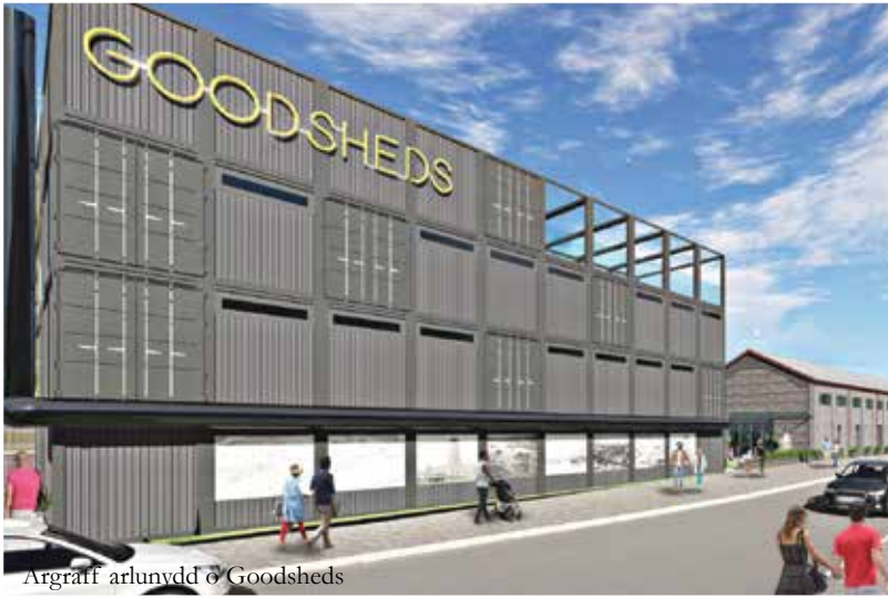
Argraff arlunydd © Goodsheds