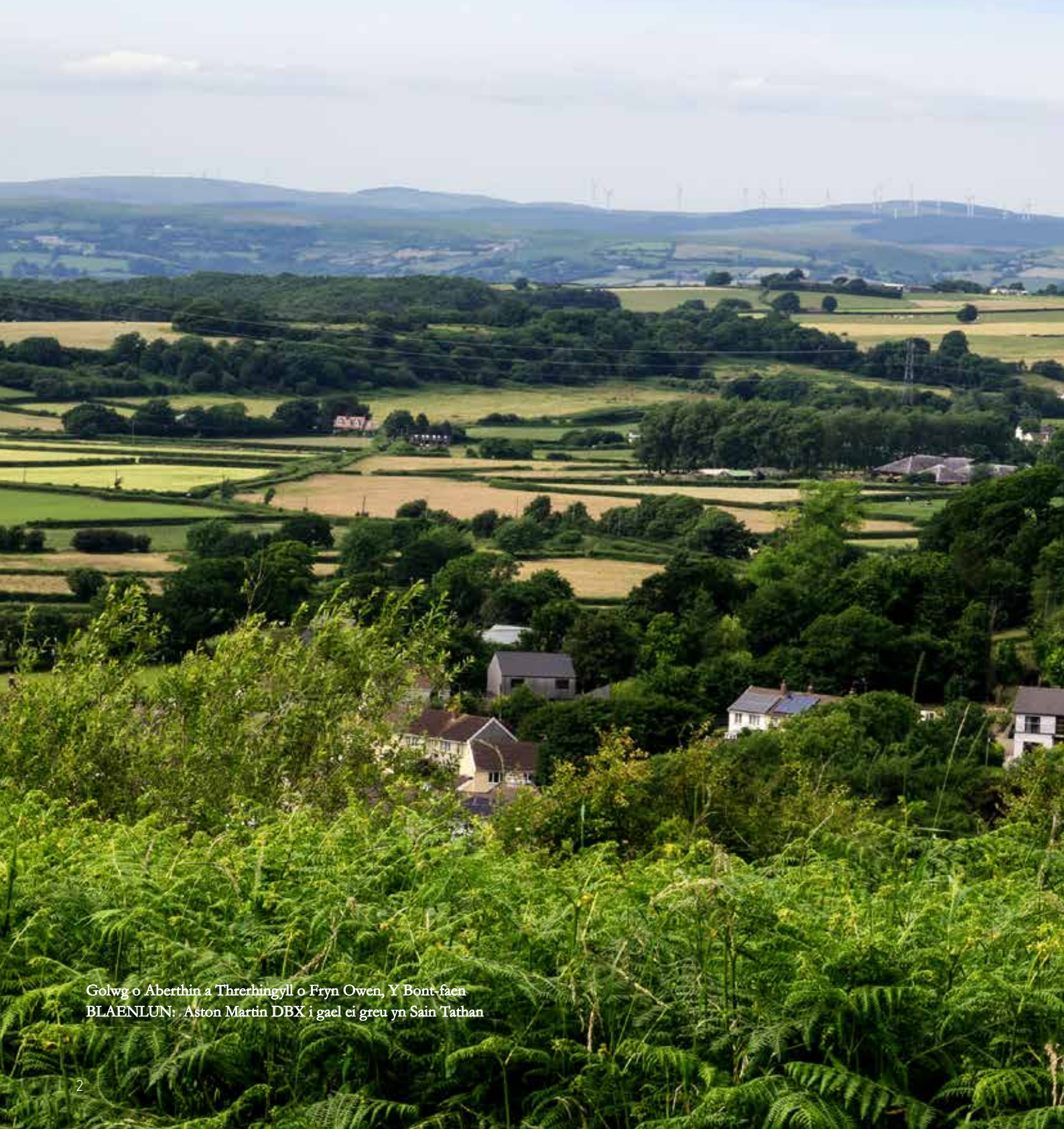
Golwg o Aberthin a Threrhingyll o Fryn Owen, Y Bont-faen BLAENLUN: Aston Martin DBX i gael ei greu yn Sain Tathan

Mae Bro Morgannwg yn un o ardaloedd mwyaf deniadol Cymru ac mae'n cael ei sgorio'n gyson yn un o'r lleoedd gorau i fyw a gweithio ynddynt yng Nghymru. Mae gan y Fro, gyda seilwaith gwych a buddsoddiad sylweddol gan Lywodraeth Cymru, yr adnoddau perffaith i ddarparu eich holl anghenion busnes ac mae'n lle gwych i'ch cyflogeion alw'n gartref iddynt.