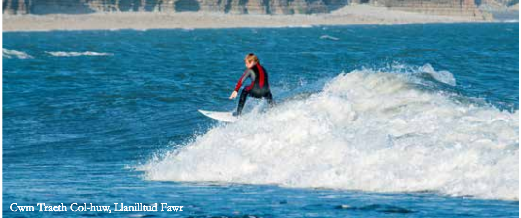
Cwm Traeth Col-huw, Llanilltud Fawr