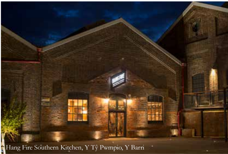
Hang Fire Southern Kitchen, Y Tŷ Pwmpio, Y Barri

Mae'r project cyffrous hwn yn dilyn y cynllun amldeffnydd wedi'i adnewyddu'n ddiweddar yn y tŷ pwmpio gerllaw. Mae'r gwaith arloesol o ailddatblygu adeilad hanesyddol yn cynnwys unedau gwaith byw, campfa a thai bwyta. Cyrhaeddodd y rownd derfynol yng ngwobrau Grand Design ac ystyrir yn un o'r projectau adfywio mwyaf llwyddiannus yn ne Cymru.