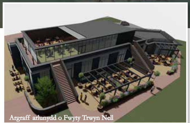
Argraff arlunydd o Fwyty Trwyn Nell