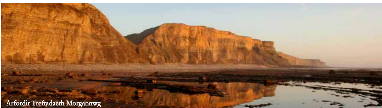
Arfordir Treftadaeth Morgannwg