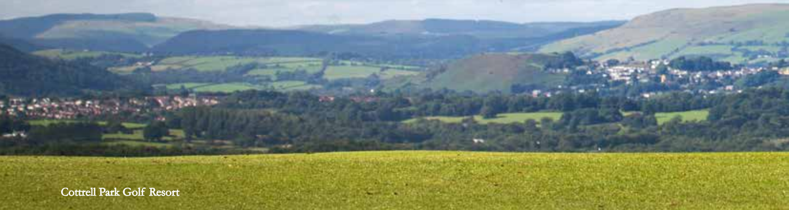
Cottrell Park Golf Resort

Cyfrinach gorau Cymru yw Bro Morgannwg. Y man mwyaf deheuol yng Nghymru yw hi ac mae ganddi arfordir trawiadol, traethau penigamp a môr gwych i syrffio ynddo. Oherwydd hyn, y Fro yw'r lle perffaith i fyw a gweithio.