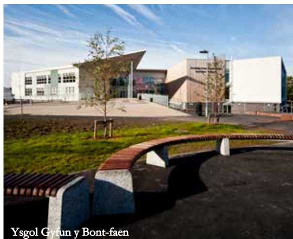
Ysgol Gyfun y Bont-faen