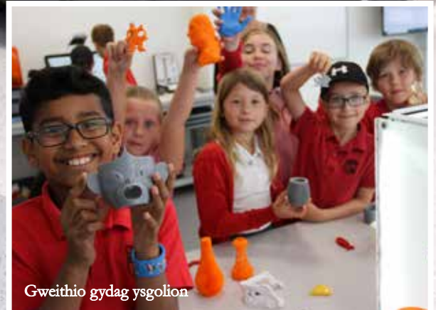
Gweithio gydag ysgolion