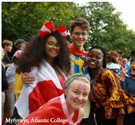
Myfyrwyr, Atlantic College