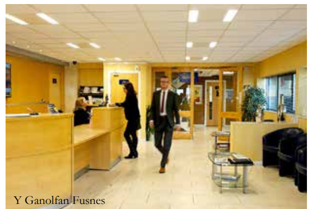
Y Ganolfan Fusnes