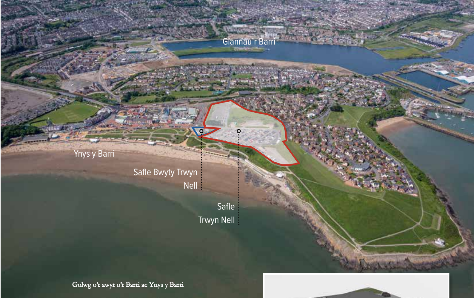
Golwg o'r awyr o'r Barri ac Ynys y Barri