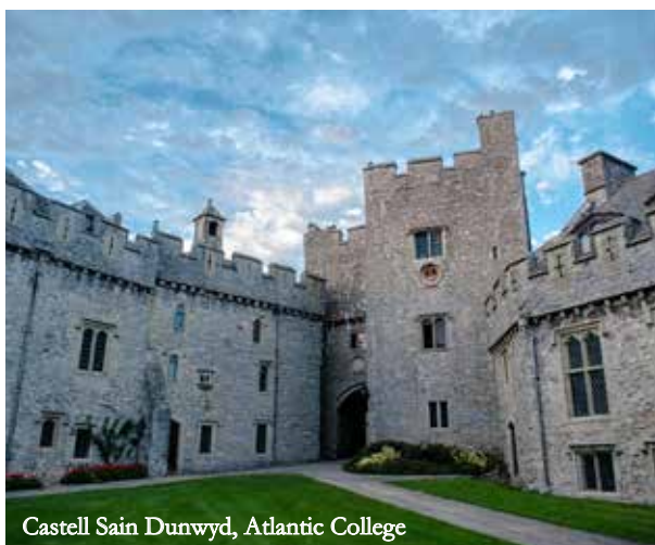
Castell Sain Dunwyd, Atlantic College