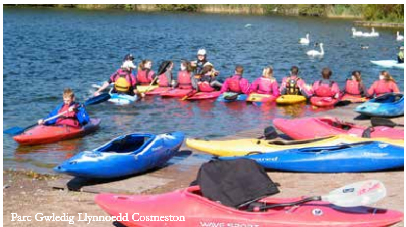
Parc Gwledig Llynnoedd Cosmeston