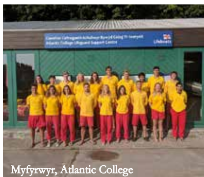
Myfyrwyr, Atlantic College