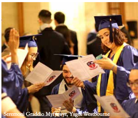
Seremoni Graddio Myfyrwyr, Ysgol Westbourne