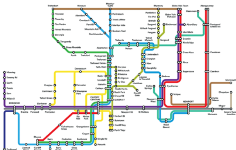
▲ Map Llwybrau Metro Posibl

“ Nod y Fargen Ddinesig yn y bôn yw cryfhau ac atgyfnerthu cryfderau sectoraidd allweddol trwy ddull sy'n canolbwyntio ar yrru arloesedd, buddsoddi, hyrwyddo datblygu seilwaith a cheisio ymatebion i rai o'r heriau mawr. ”