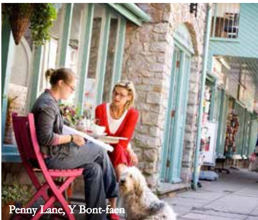
Penny Lane, Y Bont-faen