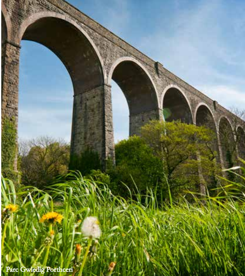
Parc Gwledig Porthceri