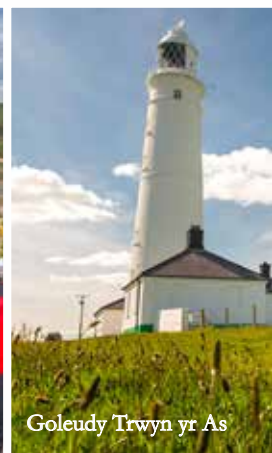
Goleudy Trwyn yr As