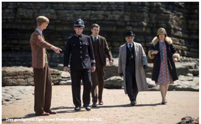
(Decline and Fall)