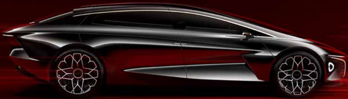
The Lagonda Vision Concept

Cyhoeddodd y gwneuthurwr ceir Prydeinig eiconig Aston Martin Lagonda yn 2016 y byddai'n agor lleoliad gweithgynhyrchu yn Sain Tathan. Wedi i'r safle 90 erw yn Sain Tathan greu argraff ar y cwmni, curodd Bro Morgannwg nifer o safleoedd cystadleuol i fod yr ail lleoliad gweithgynhyrchu i Aston Martin lle y bydd yn creu eu SUV moethus cyntaf, y DBX.