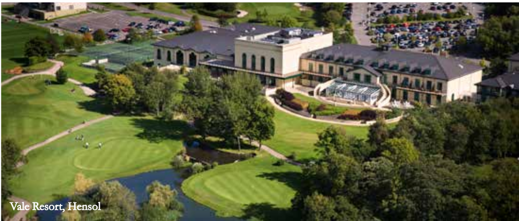
Vale Resort, Hensol