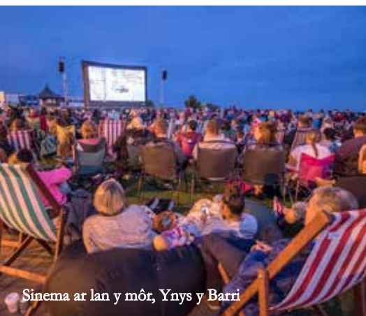
Sinema ar lan y môr, Ynys y Barri