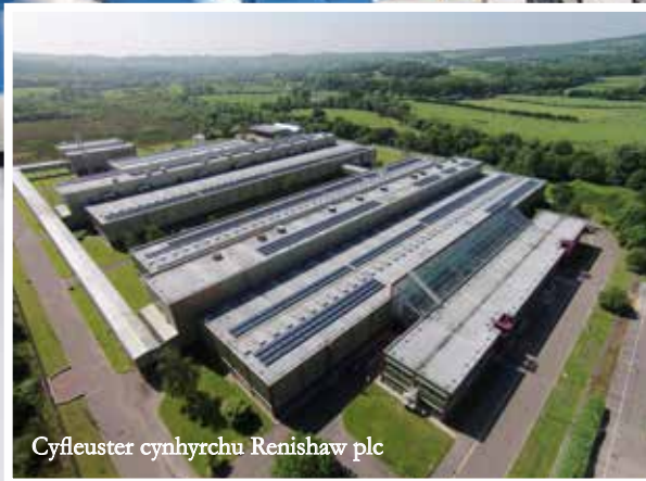
Cyfleuster cynhyrchu Renishaw plc

Er mwyn darparu ar gyfer ei datblygiad yn y dyfodol mae'r cwmni wedi amlinellu caniatâd cynllunio ar gyfer 1.7 miliwn tr. sgw. o ddatblygu ar y safle. Bydd y cyfleusterau arfaethedig yn darparu lle ychwanegol ar gyfer Renishaw a busnesau eraill i sefydlu gweithrediadau ar y safle.