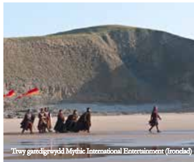
Trwy garedigwydd Mythic International Entertainment (Ironclad)

Am fwy o wybodaeth cysylltwch â film@valeofglamorgan.gov.uk