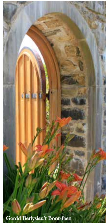
Gardd Bertlysiau'r Bont-faen