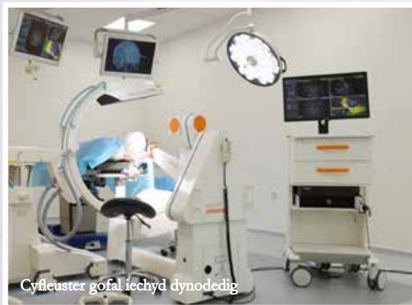
Cyfleuster gofal iechyd dynodedig

“ Mae agosrwydd safle Meisgyn at gysylltiadau trafndiaeth da, cymunedau gyda sgiliau peirianeg, ac amrywiaeth eang o bartneriaeth cydweithredu posibl yn y meysydd peirianeg a gwyddorau bywyd, wedi rhoi'r cyfle i Renishaw i greu canolfannau arbenigedd newydd a swyddi newydd. ”