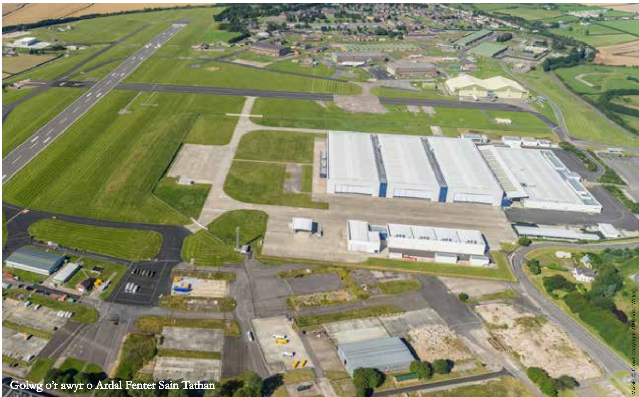
Golwg o'r awyr o Ardal Fenter Sain Tathan

► Ken Skates AS, Y Gweinidog dros yr Economi a Thrafnidiaeth