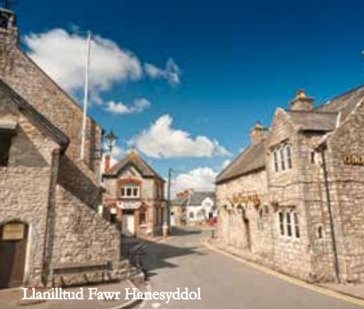
Llanilltud Fawr Hanesyddol