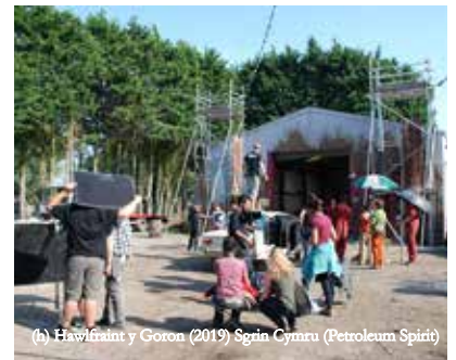
(h) Hawlfraint y Goron (2019) Sgrin Cymru (Petroleum Spirit)