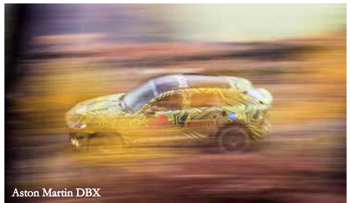
Aston Martin DBX